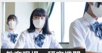
教育現場・研究機関

お客様訪問がある接客クルーやどうしても出社せざるを得ない職場でも、安心して働けることを目指します。