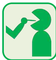
咽頭ぬぐい液検査