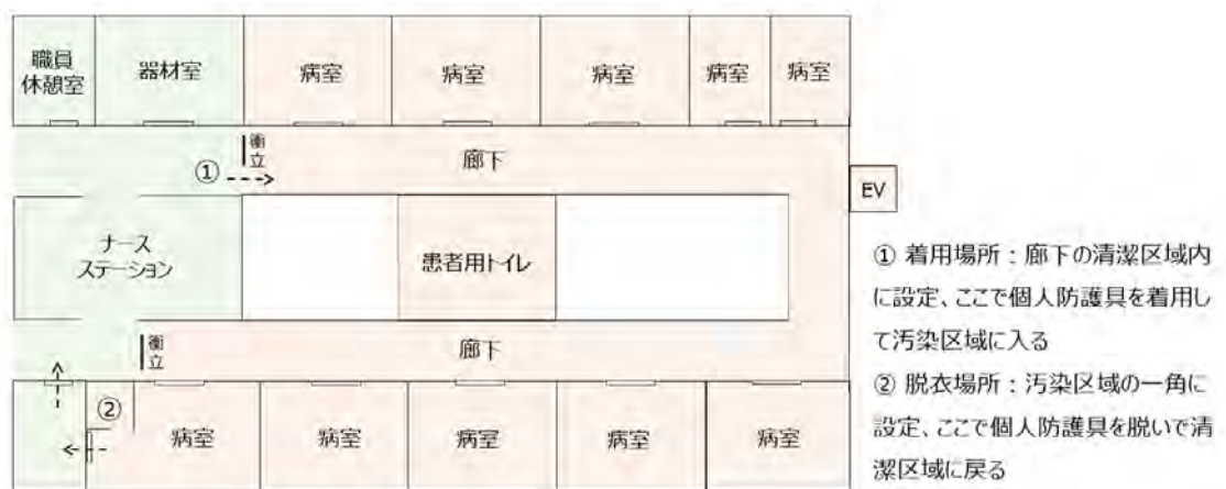
図 3. 病棟の大部分を汚染区域と設定した例

担当する医療従事者数が少なく、個人防護具が不足気味であることを踏まえ、病棟の一部をまとめて汚染区域と設定した。