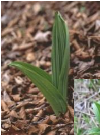
芽出し期のバイケイソウ