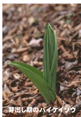
芽出し期のバイケイソウ