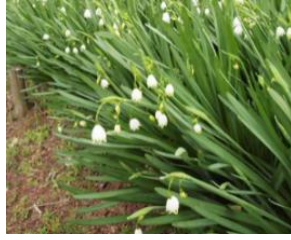
スノーフレーク (スズランスイセン)