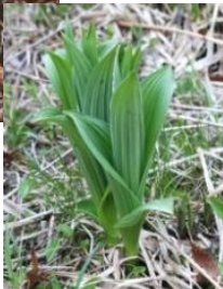
芽出し期のコバイケイソウ