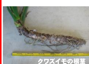
クワズイモの根茎